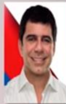
Alejandro Char Barranquilla (C. Radical)