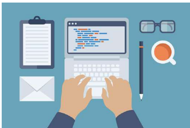
Desarrollo de soluciones

La estructura aplicada al desarrollo de productos de emprendimiento digital debe seguir el ciclo de vida que más se acomode a cada necesidad, orientando los productos a enfoques de modelado conocidos y estandarizados en la industria digital; para ello se tienen modelos de cascada, espiral, iterativo incremental, ágil, codificación y corrección entre otros.