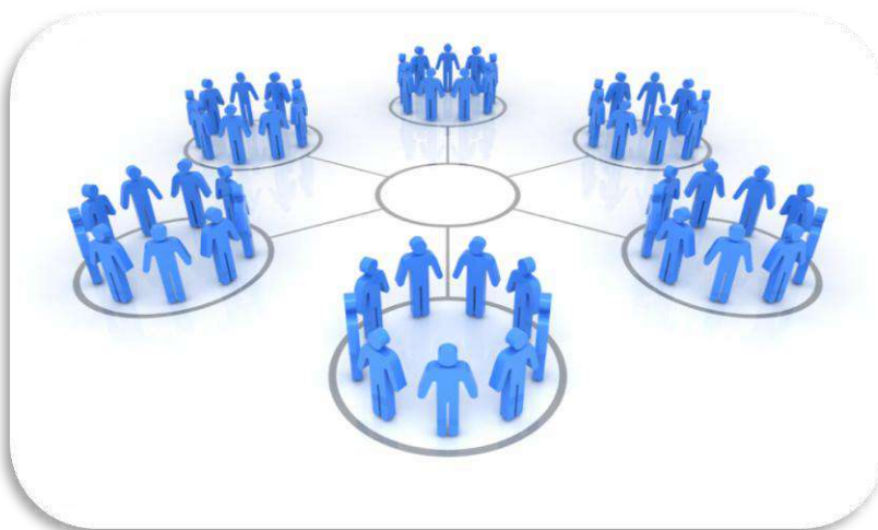
Mesas sectoriales, caracterización problemáticas de ciudad

Dentro de la metodología se deben diseñar y aplicar técnicas etnografías para la observación y clasificación de la situación actual de la ciudad de Ibagué y su posible solución por medio de las TIC; para ello se realizarán mesas de trabajo en las diferentes comunidades organizadas en Ibagué, en las cuales se acercará la administración municipal a el sector privado, universidades, comunas y sociedad civil para realizar mancomunadamente un diagnóstico de problemáticas, capacidades, talentos y oportunidades que se puedan desarrollar por medio de la tecnología.