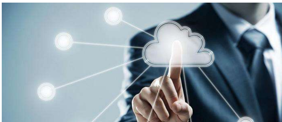
Comercialización exitosa de productos

Luego de ser implementada la solución se realizarán eventos que permitan acercar las soluciones, los emprendedores y las empresas creadas durante la ejecución del programa; las ruedas de negocio son el mecanismo por excelencia para promocionar las soluciones a los clientes potenciales y de esta manera implementarlas en diferentes entidades.