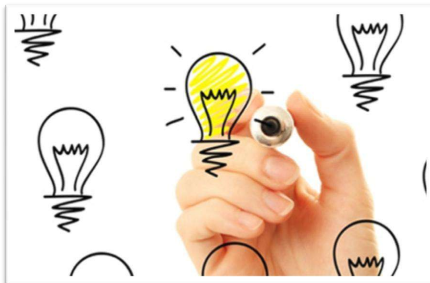
Consolidación de ideas de negocio.

Para la consolidación de ideas de negocio y desarrollo de las soluciones, se debe realizar un taller de entrenamiento práctico en proyectos tecnológicos, convocando a desarrolladores, empresarios y estudiantes de las diferentes universidades de la ciudad para realizar un ejercicio de prospectiva tecnológica y el desarrollo de capacidades TIC a problemáticas de la ciudad.