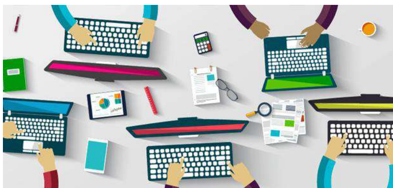
De la idea al negocio.

Después de realizar el bootcamp, se sigue la estrategia con los participantes que han venido siendo parte del proceso, se realiza el segundo taller llamado hackatón la cual tiene por objetivo profundizar más en las estrategias vistas en el bootcamp y