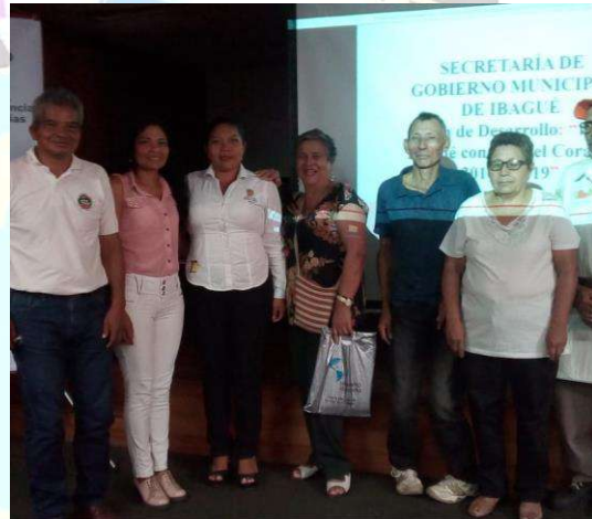
Socialización programa con criterios diferenciales, 2 de noviembre 2018 (9.00-11 a.m.) - Auditorio Biblioteca Darío Echandía