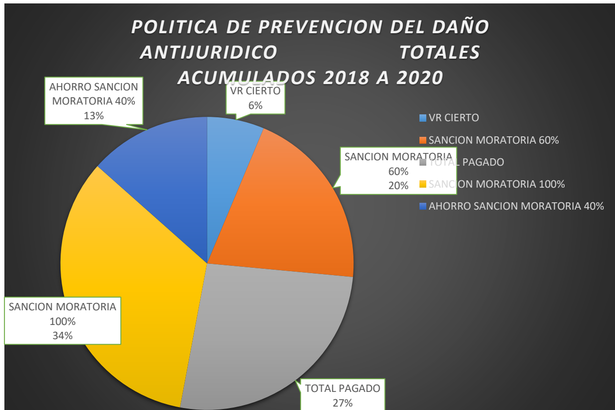
CUADRO 3 – comparativos años 2018, 2019 y 2020.