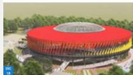
Adjudicada interventoría del Coliseo Mayor por parte del Gobierno Nacional

https://www.ibague.gov.co/portal/seccion/noticias/index.php?idnt=8998